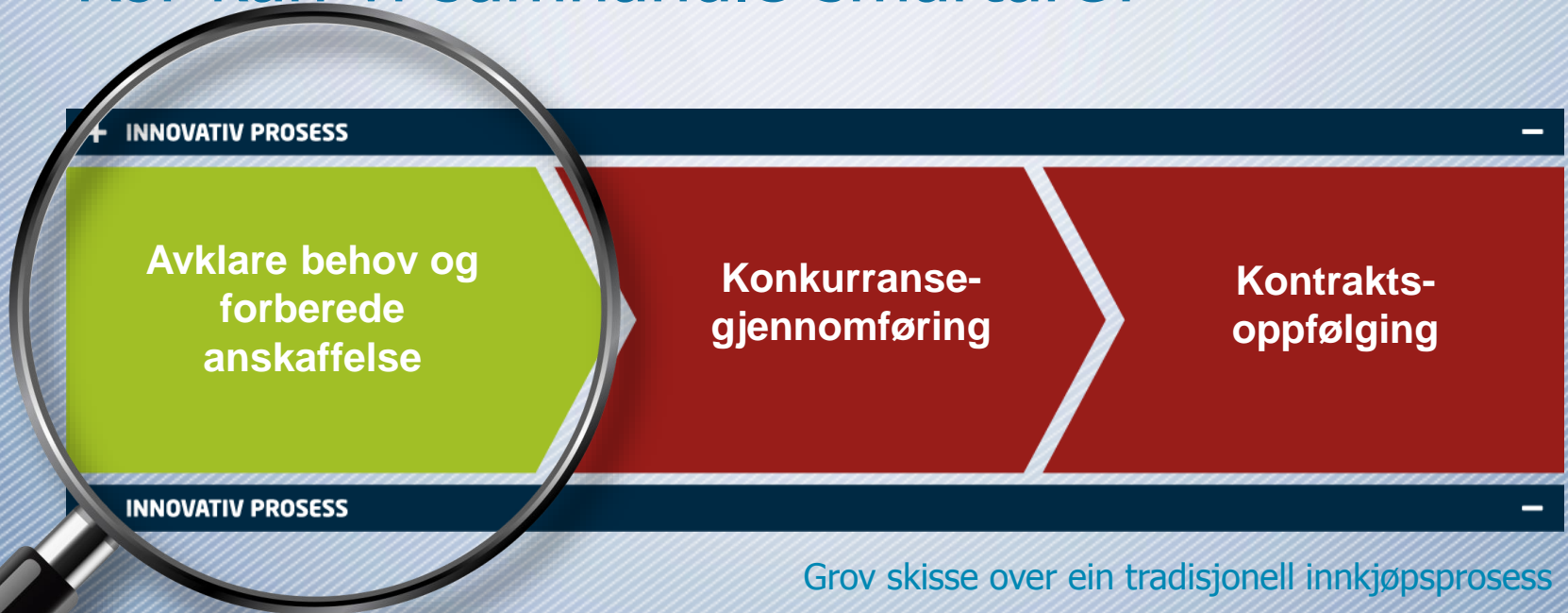
Grov skisse over ein tradisjonell innkjøpsprosess